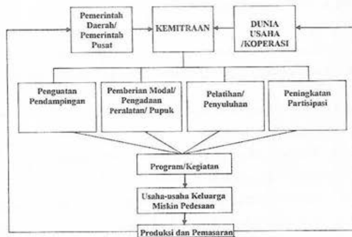
Gambar 2. Mekanisme strategi penanganan keluarga miskin pedesaan

Dalam pelaksanaan strategi penanganan keluarga miskin pedesaan ini, keberhasilannya sangat ditentukan oleh motivasi dari keluarga miskin. Pemerintah dan dunia usaha hanya bersifat pendamping dan tidak akan selamanya berada di lingkungan keluarga miskin. Indikator keberhasilan